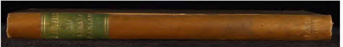
Early European Books, Copyright © 2012 ProQuest LLC. Images reproduced by courtesy of The Wellcome Trust, London. 5488/A